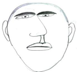
Desenho 3. Elaborado por sujeito 4

Freire (apud NASCIMENTO et al. , 2006) assinala que no Brasil, o principal desafio consiste em apoiar todas as iniciativas que permitam compreender que a adoção deva ser vivida fundamentalmente para a criança, cabendo aos adotantes o gesto maduro do amor incondicional, apoiados por movimentos sociais competentes em todas as fases da integração familiar adotiva. Essa análise enfatiza que as crianças que participaram da pesquisa possuem uma expectativa positiva em relação à família adotiva, porém tornaram evidentes as dificuldades em relação a esse período; em determinados momentos argumentaram não saber como seria a família adotiva ou como realmente seria ser adotado. Nota-se, na história 2 do sujeito 4, 11 anos e 8 meses: “Não sei como é uma criança adotada, nunca vi [...]” Também é importante colocar que, apesar desse aparente desconhecimento sobre adoção, este sujeito, por ser o mais velho, já tem conhecimento de que será adotado, tanto que quando solicitado que desenhasse uma criança sendo adotada fez um autorretrato.